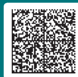
2D Barcode Data Matrix with 200 characters

Det nye verifikationsystem har til formål at forbedre patientsikkerheden ved individuel kontrol af alle lægemiddelpakningers ægthed. I praksis betyder modellen, at EAN-stregkoden skal udskiftes med en 2D matrix kode, som bl.a. indeholder identifikationskode, batchnummer, udløbsdato samt et tilfældigt serienummer. Alt sammen uden at fylde for meget på pakningen.